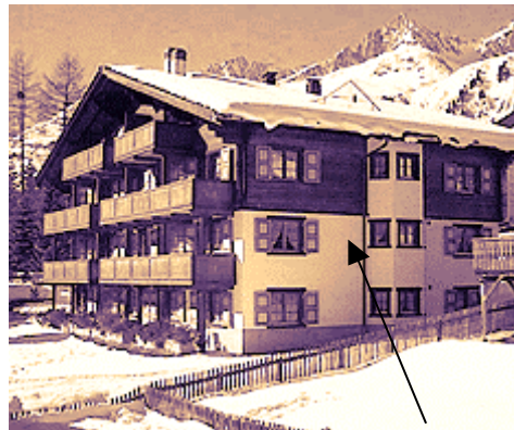
Wohnung Tgèsa Curnera